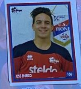
OSS ENRICO 166