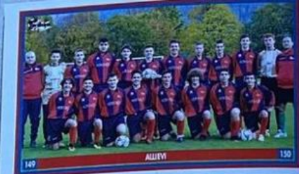
147 ALLIEVI 150