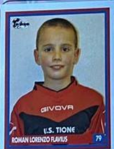
ROMAN LORENZO FLAVIUS 79