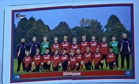
GIOVANISSIMI 126 127