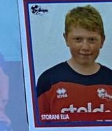
STORANI EJA 145