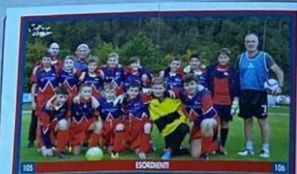
105 ESORDIENTI 106