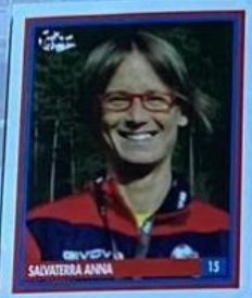
ALLENATORE PICCOLI AMICI