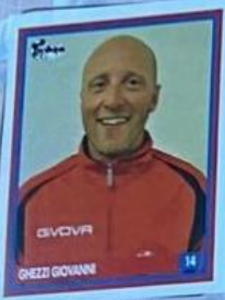
ALLENATORE PRIMI CALCI