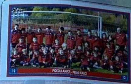
PICCOLI AMICI - PRIMI CALCI