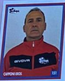
CUPONI EROS 151