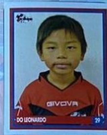
DI LEONARDO 29