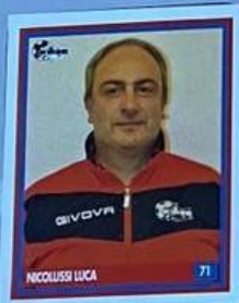
ALLENATORE E DIRIGENTE RESPONSABILE PULCINI