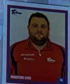
RESPONSABILE PRIMI CALCI E PICCOLI AMICI